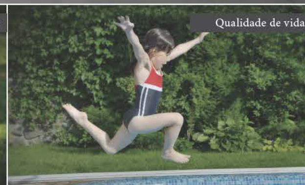
Qualidade de vida