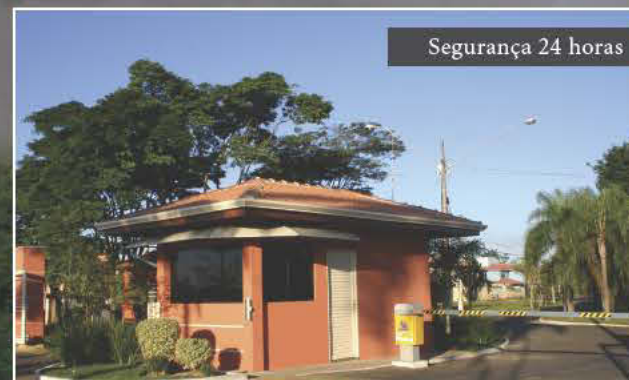
Segurança 24 horas