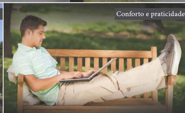
Conforto e praticidade